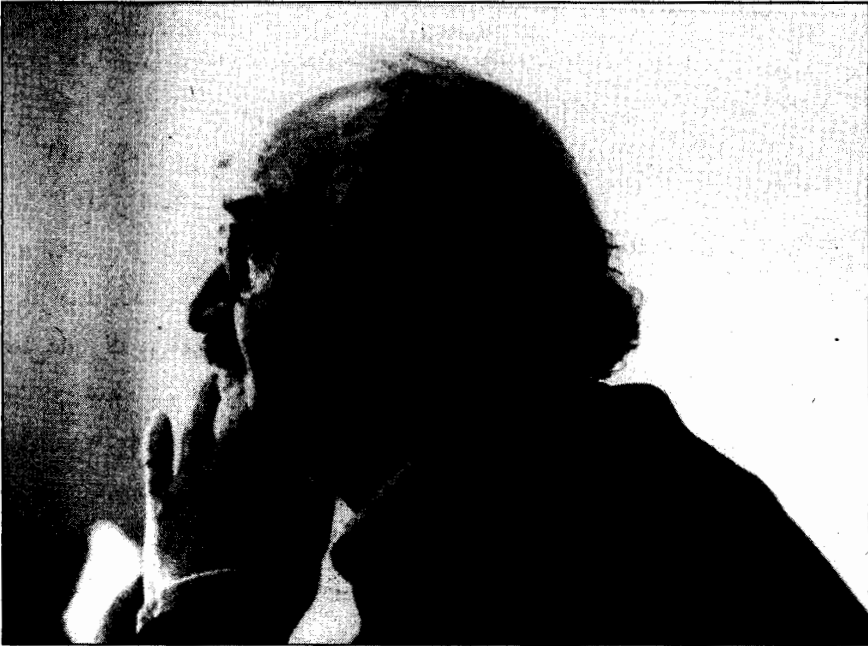
• دکتر محمدرضا شفیعی کدکنی

از ساختار کهن متن عدول: مرا تو می باید. (برای مثال و نمونه: نسخه موزه هرات (مورخ ۶۷۰) و نسخه تاشکند (مورخ ۶۸۵) و نسخه پاکستان (مورخ ۶۹۷) و نسخه پیرهدالی سلیم آغا (مورخ ۶۹۲).