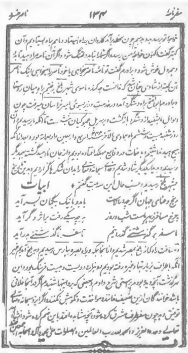
صفحه آخر سفرنامه چاپ دهلی

محمد یعقوب علی است و در حاشیه و بین سطرهای آن، توضیحاتی در مورد معانی واژه‌ها و مکان‌ها داده است که اطلاعات تازه‌ای به دست می‌دهد. بعضی کلمات نیز اعراب گذاری شده است که خواندن متن را دقیق‌تر می‌سازد. سیدحسن، رئیس بخش فارسی زبان و ادبیات فارسی دانشگاه پتنه هند، مقاله‌ای در معرفی این کتاب نوشته و گفته است این نسخه در کتابخانه برادر رضاعی جلال‌الدین اکبرشاه (۱۵۴۲ تا ۱۶۰۵ میلادی) فرمانروای مغول هندوستان وجود داشته و مقدمه الطاف حسین حالی عنوان قدیمی‌ترین مقدمه بر سفرنامه است. او مقاله خود را همراه با مقدمه الطاف حسین حالی در سال ۱۳۳۲ هجری شمسی در مجله فرهنگ ایران زمین منتشر ساخته است.