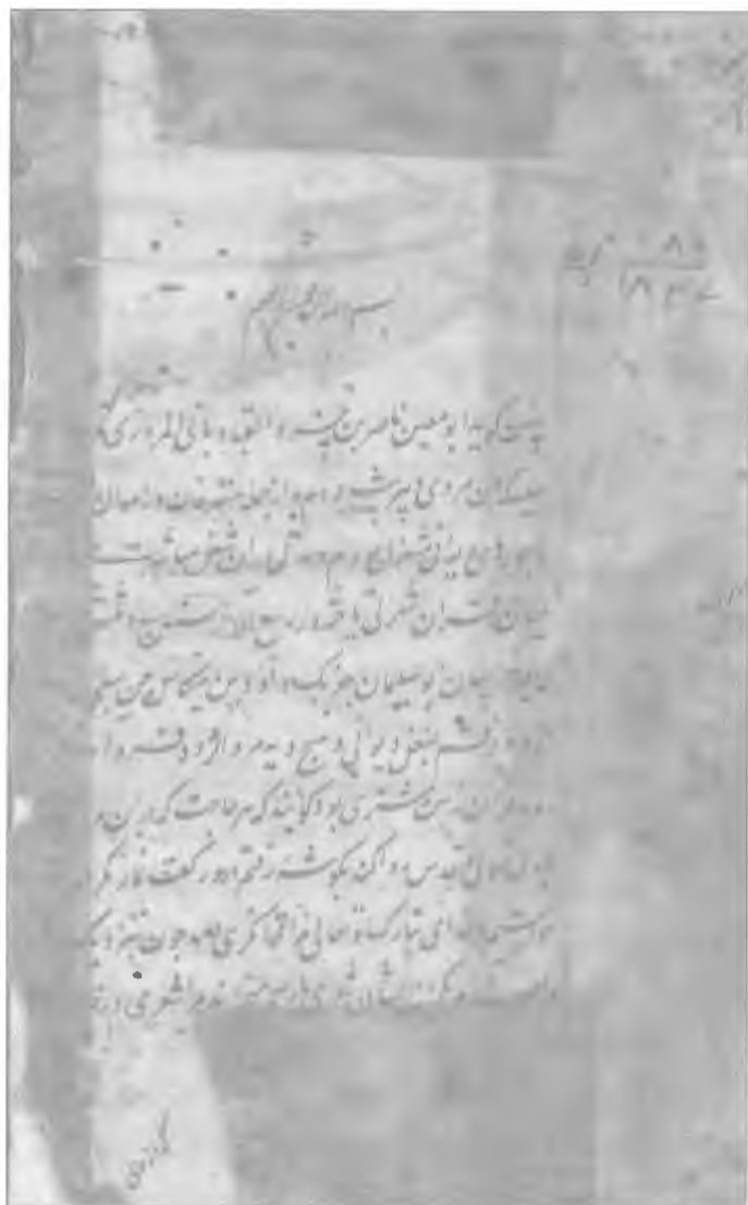
صفحة اول سفرنامه نسخه لکنهو