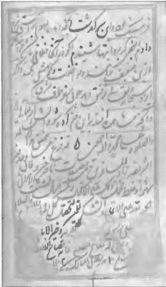
صفحه آخر سفرنامه نسخه بریتانیا

به نظر می‌رسد که در سال‌های حوالی کتابت این نسخه (سال ۱۱۰۲ هجری قمری) که نواده‌های بابرشاه، از فرمانروایان مغول، بر افغانستان حکومت می‌کردند، کوششی برای بزرگداشت ناصرخسرو انجام شده باشد. زیرا سومین مرمت آرامگاه ناصرخسرو، چنانکه بر تیرک‌های چوبی