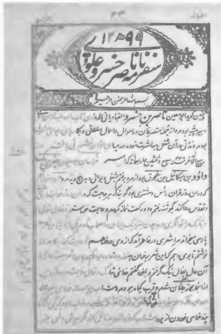
صفحه اول سفرنامه چاپ دهلی

۲. چاپ (سنگی) دهلی که همراه با مقدمه‌ای به قلم خواجه الطاف حسین حالی، شاعر اردو زبان، در سال ۱۲۹۹ هجری قمری، برابر با سال ۱۸۸۲ میلادی، منتشر شده است. متن کتاب به خط نستعلیق و به خط