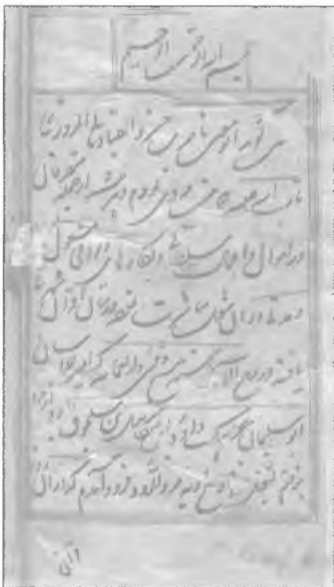
صفحه اول سفرنامه نسخه بریتانیا

۲. نسخه‌ای که در کتابخانه بریتانیا نگهداری می‌شود (نسخه بریتانیا). این نسخه تاریخ سال ۱۱۰۲ هجری قمری، برابر با ۱۶۹۱ میلادی را دارد و به شماره Add.18418 در موزه بریتانیا نگهداری می‌شده است، اما اکنون به کتابخانه بریتانیا منتقل شده است و نویسنده یک نسخه الکترونیک آن را تهیه کرده و در این تصحیح سفرنامه از آن استفاده کرده است. اولین بار گای لسترنج در پاورقی ترجمه بخش فلسطین و شامات سفرنامه به انگلیسی که در سال ۱۸۹۳ منتشر شد، از وجود این نسخه در موزه بریتانیا خبر داده است.