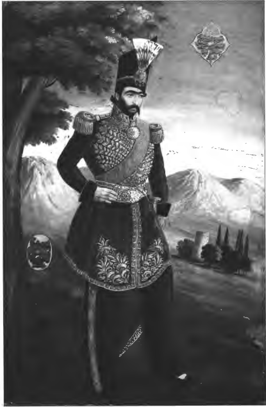
▲ تصویر ۳. ناصر الدین شاه در جوانی، اثر صنیع الملک، ۱۲۶۹ ق