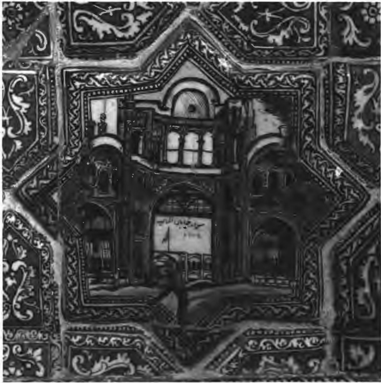
▲ تصویر ۵. کاشی هفت‌زنگ با نقش سردر باب همايون، ۱۳۱۶ ق (دروازه‌های تهران، کيانوش معتقدی)