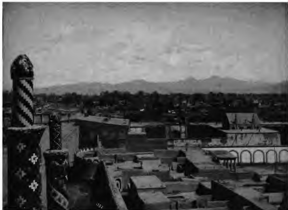
نمایی کلی از محله دولت در دوره ناصری.