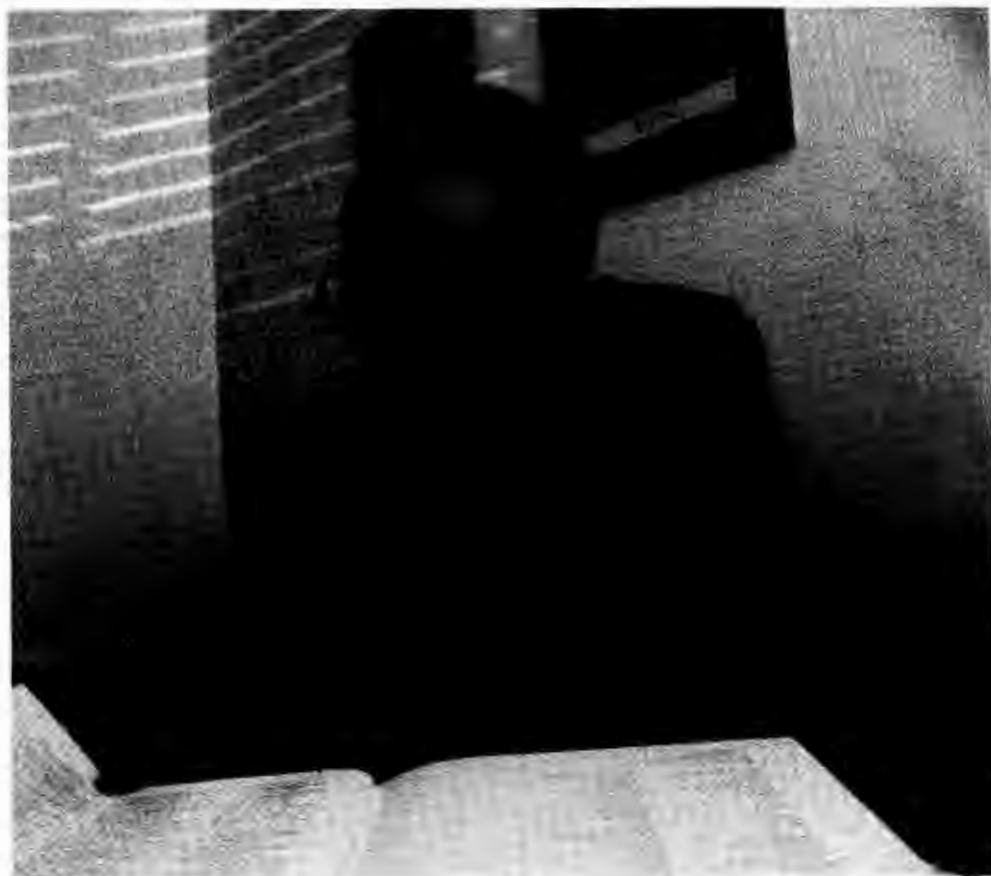
استاد ایرج افشار (۱۳۰۴-۱۳۸۹ش) بنیادگذار فهرست مقالات فارسی